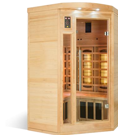
2 / 3 Places d'angle